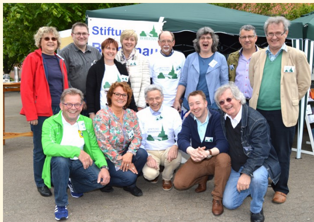
Stetigkeit im Wechsel: Stiftungsmitglieder auf dem Bürgerfest im Jahr 2015.

Fünf Personen werden zum Vorstand gewählt, die übrigen Stiftungsmitglieder bilden den Beirat. Die Amtsperiode des Vorstands beträgt 3 Jahre, einmalige Wiederwahl ist zulässig. Dank dieser Regelung wurde immer wieder ein belebender Wechsel erreicht.