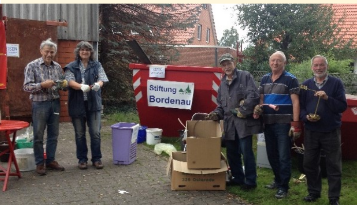
Schrott stiften 2015: Alte Fahrräder, Öfen und viele Kleinteile; das Engagement wurde mit 2 000 Euro für die Stiftungskasse belohnt.